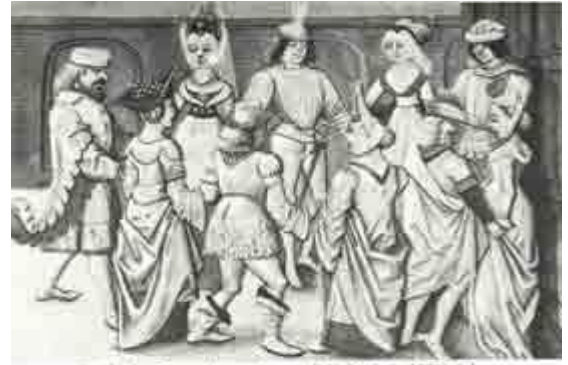
Branle, Les Danes de vous Amour, B.N. fonds fr. 1696, f. 1.